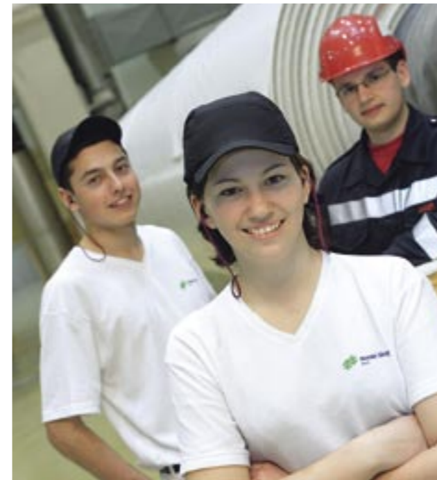
„The Spirit of Norske Skog.“