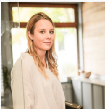
Das MAREINER HOLZ Umweltteam

„Unsere Werte sind unsere Wurzeln“ – diese Philosophie entstand im Sägewerk mit sieben Mitarbeitern, welches sich im Laufe der Jahre zu einer Holzmanufaktur entwickelte und heute in über 10 Länder exportiert. Der Philosophie und den Werten ist man stets treu geblieben, so stammt auch heute das verarbeitete Holz vorwiegend aus heimischen Wäldern. Den Großteil liefern steirische Forstwirtschaften, die zu 100% ökologisch betrieben werden und das PEFC- sowie FSC-Siegel tragen. Die Oberflächenveredelung ist durchgehend umweltfreundlich – zum Einsatz kommen nur die vier Elemente Feuer, Erde, Wasser und Luft. Durch Bürsten, Hacken, Brennen, Verkohlen und diverse Schnitttechniken werden die Holzoberflächen den Kundenwünschen entsprechend personalisiert. Laufend werden die unterschiedlichen Techniken mit dem Ziel, langlebige Produkte zu schaffen, weiterentwickelt.