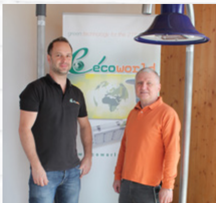
Das ECOWORLD Umwelteam

Durch die weltweite Vernetzung unserer Gruppe über Europa, USA, Südamerika und Asien, ist uns ein uneingeschränkter Zugang zu laufenden Weiterentwicklungen in der LED Technik ohne Zeitverzögerung möglich und gibt uns einen entscheidenden Vorteil, rasch auf die Bedürfnisse unserer Kunden einzugehen. Ziel des Unternehmens ist es, ein 360° Paket für unsere Kunden zu schnüren, welches die Auslegung, Berechnung der Energieeinsparung, der Produktion, Montage und Wartung der LED Leuchtmittel beinhaltet. Unser Forschungs- und Entwicklungsteam arbeitet ständig an den Verbesserungen der vorhandenen LED Produkte sowie an neuen Designs und Varianten, um unsere Kundenwünsche befriedigen zu können. Zuverlässigkeit und die bekannt hohe österreichische Qualitätsarbeit stehen im Vordergrund.