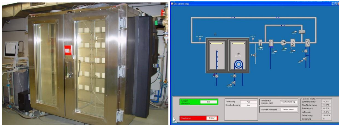
Bild.2: Photographische Ansicht der laufenden Schnellbewitterungsanlage (links) und Screenshot des Überwachungsprogramms (rechts).

Die in Bild 2 gezeigte Versuchsanlage besteht aus einer Edelstahlkammer, deren Rückwände gekühlt werden können, um die Oberflächentemperatur der darauf angebrachten Fassadenbeschichtungen unter die Taupunkttemperatur abzukühlen und somit eine Betauung der Probekörper zu erreichen. Über einen Zeitraum von ca. 8 Stunden wird der Taupunkt um 1,5 K unterschritten. Durch seitlich angebrachte Öffnungen wird entsprechend dem ausgewählten Prüfklima konditionierte Luft eingebracht. Die Beregnung der Proben mit entkalktem Leitungswasser erfolgt von vorne über Düsen. Um eine gegenseitige Kontamination der Proben durch ablaufendes Wasser zu verhindern, befinden sich unter jeder Probenreihe Ablaufrinnen. Zur Beleuchtung sind seitlich an den Türen zwei Lampen angebracht, die an den Proben im Tag-Nacht-Wechsel eine Beleuchtungsstärke von 650 Lux erzeugen.